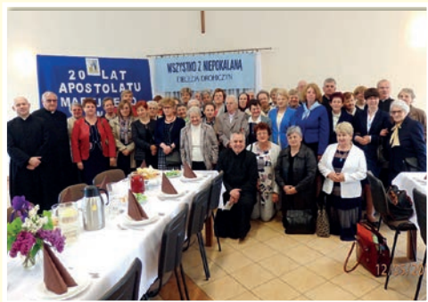
20-lecie w Perlejewie