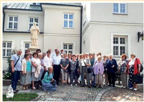
Przed Domem Sióstr Miłosierdzia w Warszawie