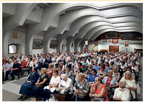
Piątkowe spotkanie w Sali Kordeckiego