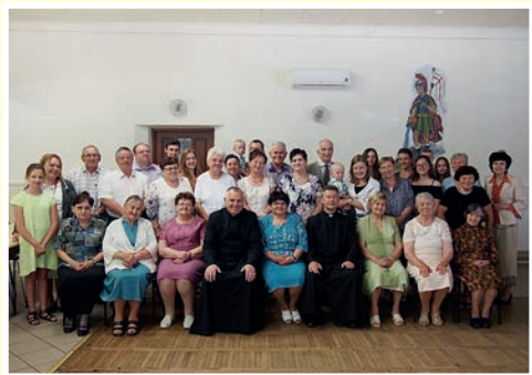
25-lecie w Kisielowie