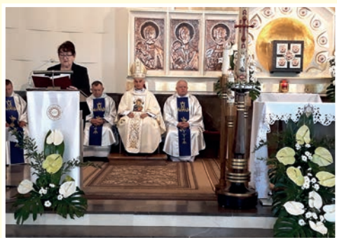
Dzień Skupienia w Morawicy