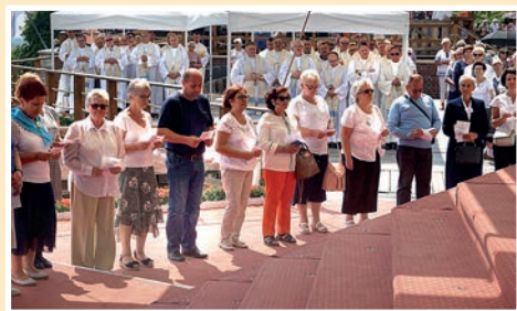
Uroczyste przyrzeczenie kandydatów