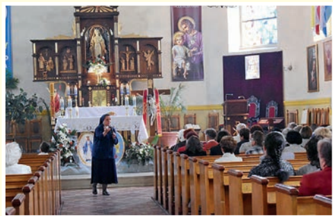
10-lecie w Jasieniu