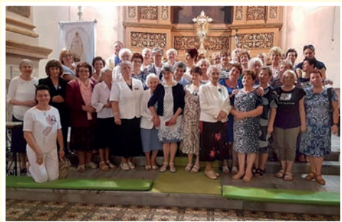
35-lecie w Kłodzku