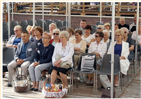
Organizatorzy z diecezji łódzkiej