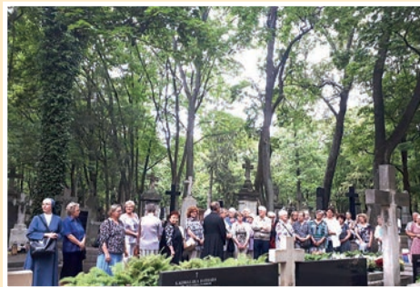
Na powązkowskim Cmentarzu