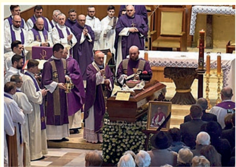
Bp Kazimierz Nycz przy trumnie ks. Kapalki