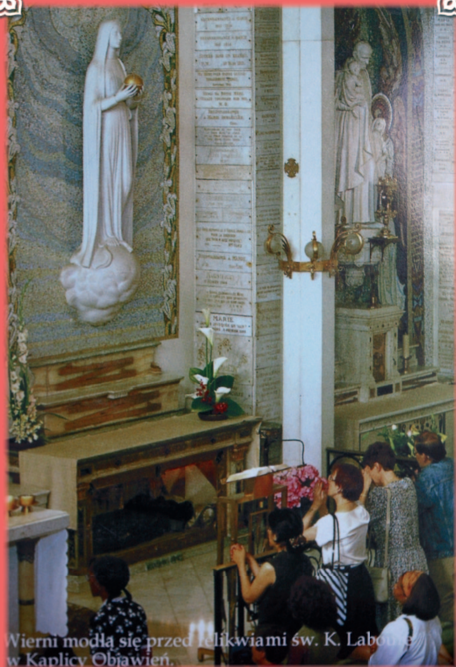
Wierni modlą się przed relikwiami św. K. Laboulaye w Kaplicy Objawień.