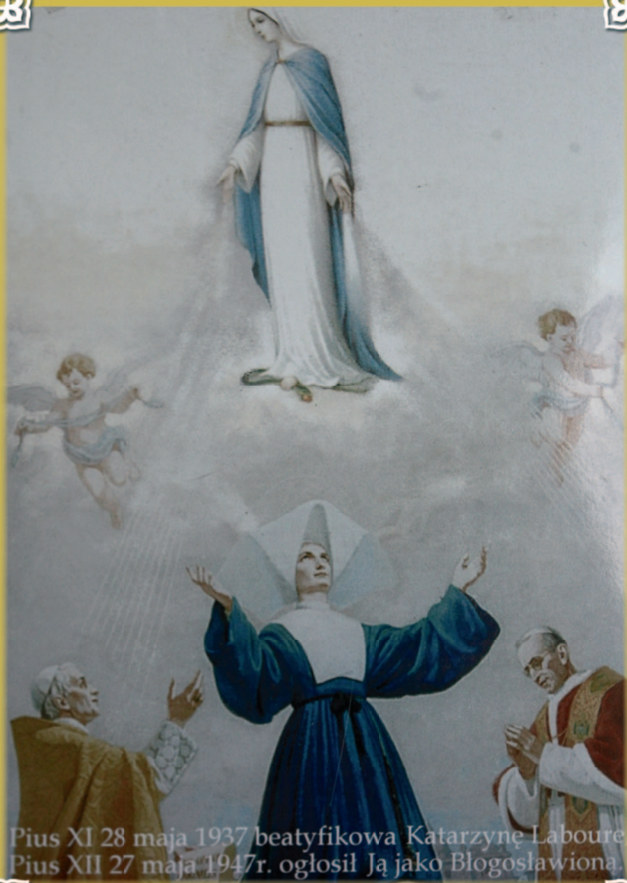
Pius XI 28 maja 1937 beatyfikowa Katarzynę Laboure, Pius XII 27 maja 1947r. ogłosił Ją jako Błogosławioną.