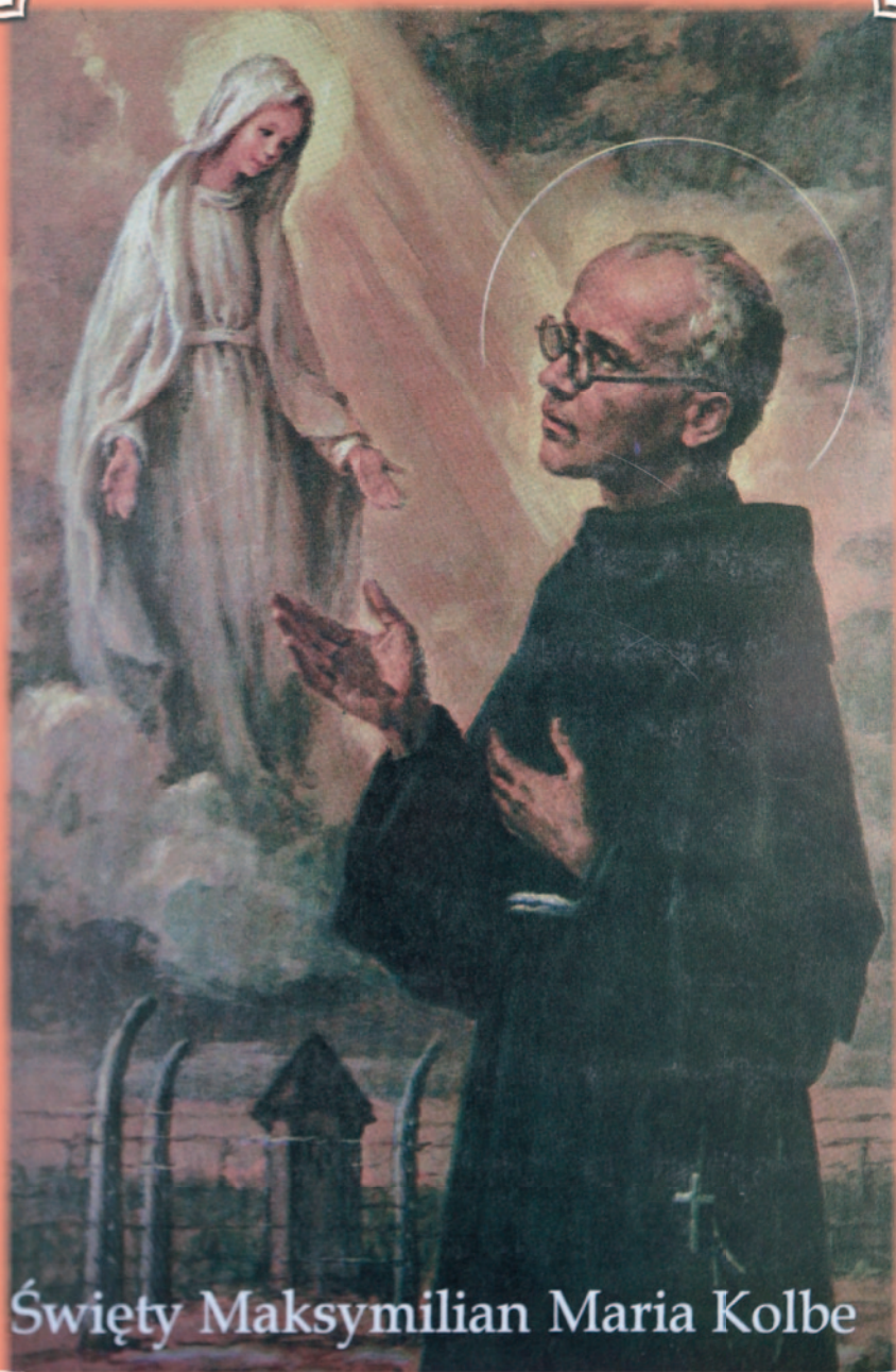
Święty Maksymilian Maria Kolbe