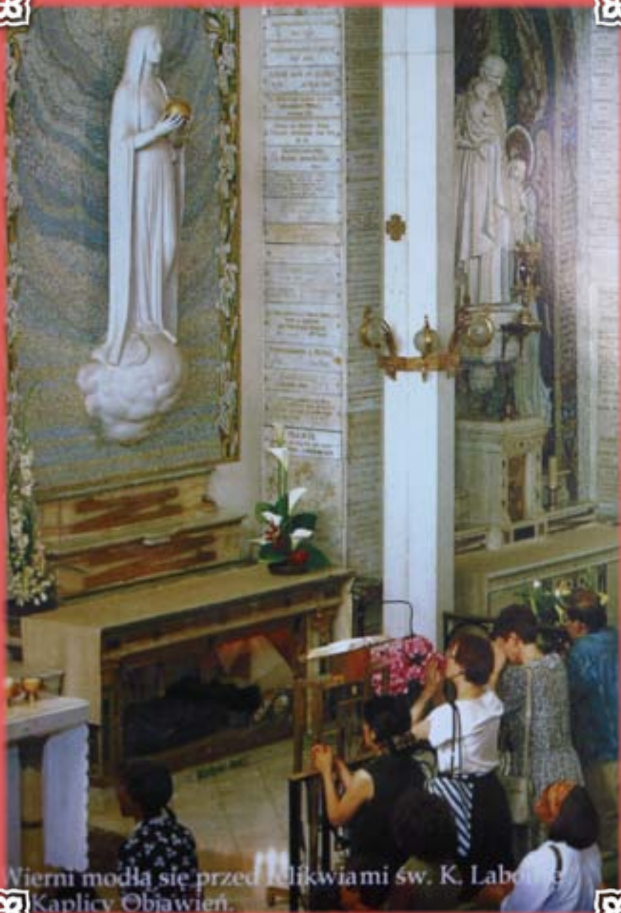
Wierni modlą się przed relikwiami św. K. Laboniusza w Kaplicy Objawień.