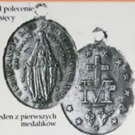
Jeden z pierwszych medalików