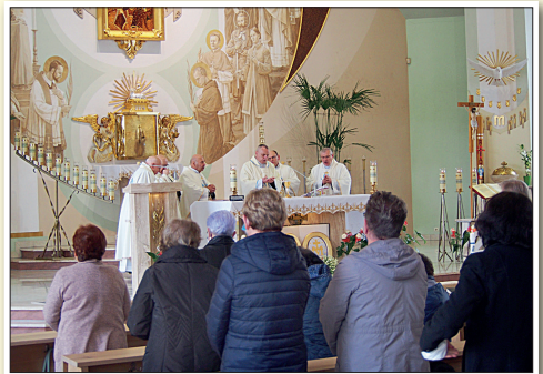
25-lecie w Pogórze