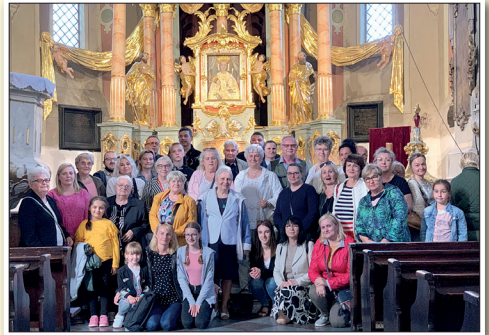
Grupa z Tczewa