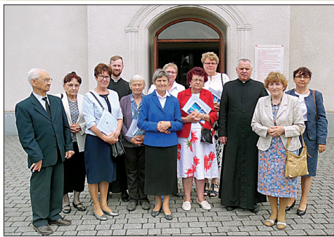
25-lecie w Ochabach