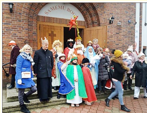
Orszak Trzech Króli w Gozdnicy